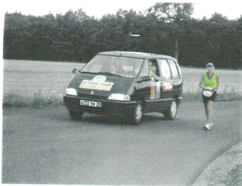
La transe Gaule (1190 km)