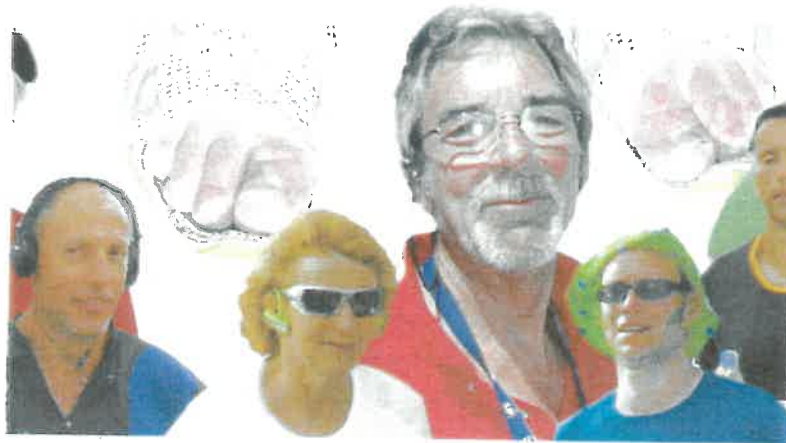
6 jours du Luc en Provence