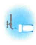
Schéma directeur d'alimentation en eau potable (SDAEP)

Le SDAEP permettra la cartographie de tout le réseau d'eau potable, du prélèvement dans le milieu naturel jusqu'au branchement de l'abonné. À terme, cet état des lieux devra permettre de concilier tous les usages de l'eau, d'optimiser la distribution à l'échelle du territoire et de programmer des travaux d'amélioration des 2 200 kms du réseau (notamment en réduisant les fuites). L'étude démarrera en janvier 2021 pour une durée de trois ans.